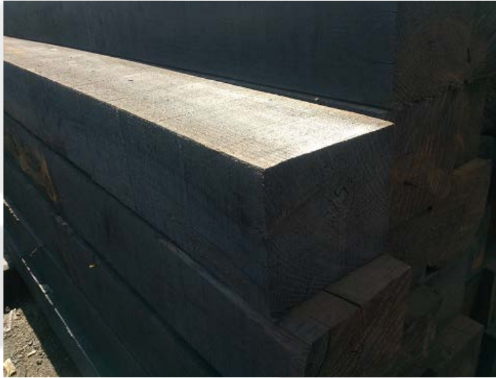
Durmientes de pino impregnados.