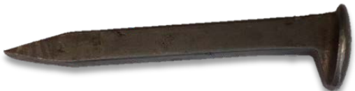
Clavo de 5/8" x 6"