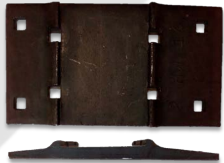
Placa de asiento doble hombro.