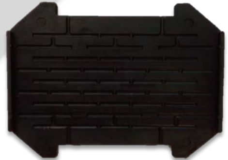
Almohadilla de plástico elastómero.