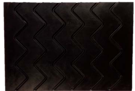
Placa de hule chevron.