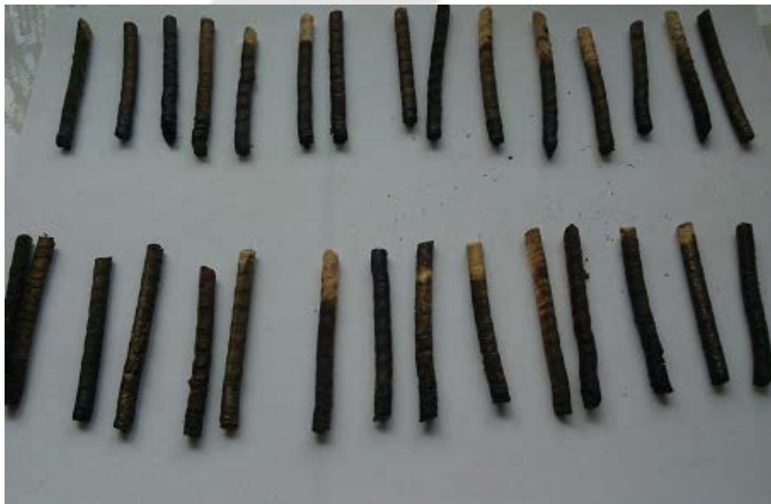
Muestra de gusanillos de madera de pino que muestran impregnación