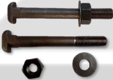
Perno SL 22.2 mm X 210 mm negro y galvanizado.