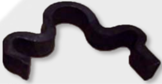
Ancla tipo Wooding.