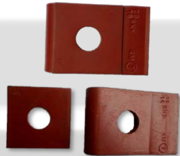
Grapa RN 7 con refuerzo.