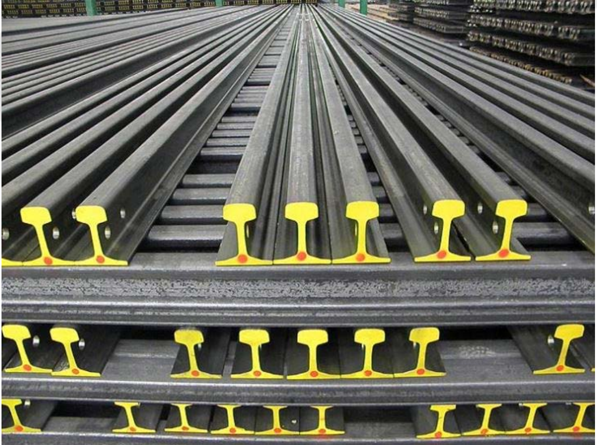
Riel de acero.