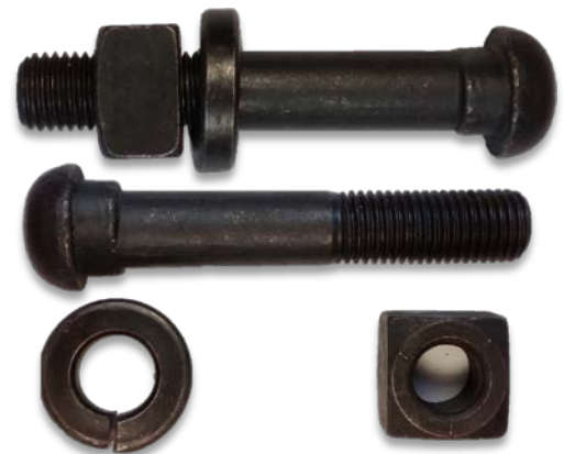
Tornillo de vía con tuerca y roldana de presión.